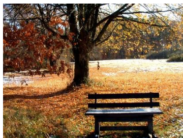
Enzianwiese am Sinne-Reich

Grenzweg : Die winterlichen Felder und Wälder entlang der historischen Grenzen erstrahlen oft in Reif, und die klare Luft macht die Landschaftskonturen besonders lebendig.