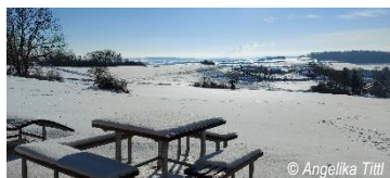
Ausblick Maria Steinbrunn

Sinne-Reich : Spüre die Kälte unter deinen Füßen und die Winterstille um dich herum – ideal für achtsame Naturerlebnisse.