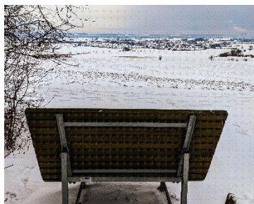
Panoramaliege am Sagenhaft

Sagenhaft : Am Lutzinger Goldberg sorgt der Nebel zwischen den Bäumen für eine fast mystische Atmosphäre – begleitet vom leisen Rascheln der Blätter.