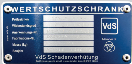
Marke der Zertifizierungsstelle VdS